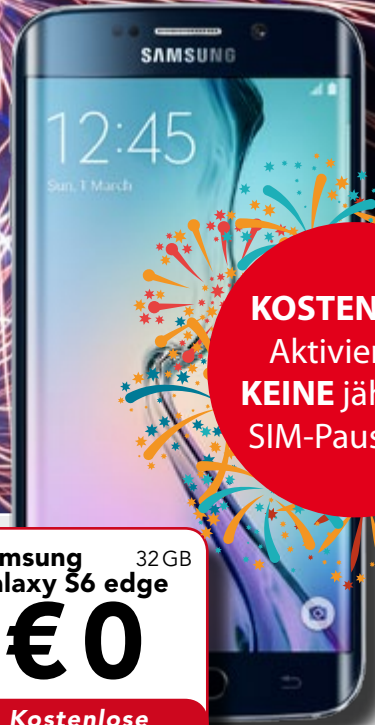
Samsung Galaxy S6 edge 32GB